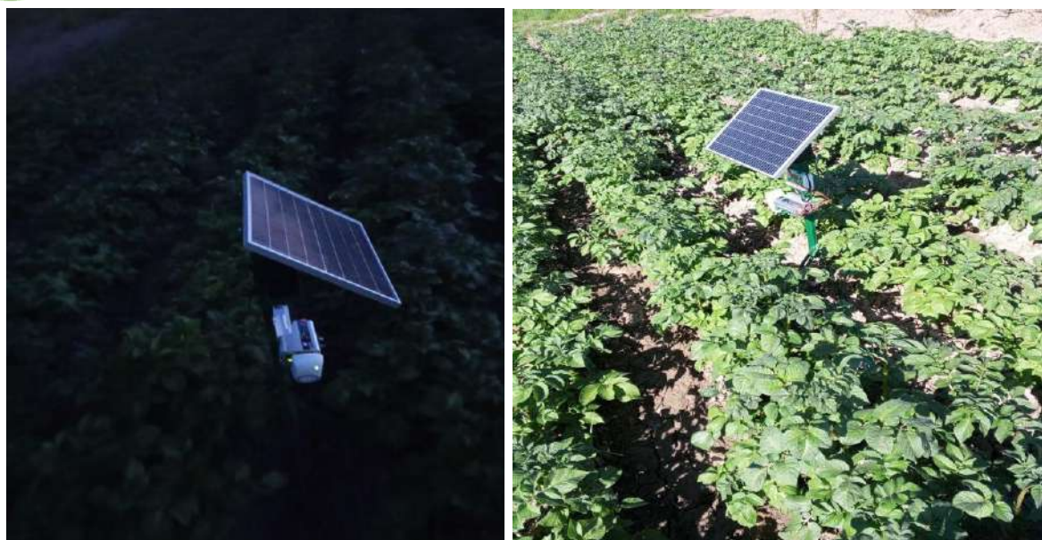
3-rasm. Quyosh batareyasi bilan taminlangan ultratovish tarqatish qurilmasi.