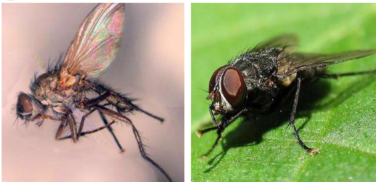
1-rasm. Piyoz pashshasining erkagi (o'ngda) va urg'ochisi (chapda).

Zararlangan o'simliklarni oldin sariq-kulrang tusga kiruvchi qurigan va so'ligan barglaridan oson aniqlab olish mumkin. Piyozi pashshasi piyoz ko'chatlarini, boshpiyozlarni va urug'lik piyozlarni zararlashi mumkin. Ko'chat olish uchun ekilgan piyozi ayriqsa ko'p zarar ko'radi chunki lichinkalar zich ekilgan piyoz tuplarining biridan boshqasiga o'tib ketaveradi. Rossiya sabzavotchilik inosituti olgan ma'lumotlarga ko'ra piyoz pashshasining lichinkalari 50 smga qadar o'rmalab borishlari mumkin. Piyozi bosh shakllangandan keyin zararlanganda lichinkalar boshqa tuplarga ko'chmaydi. Osh piyozdan tashqari oz miqdorda sarimsoq piyozga ham zarar keltirishi mumkin. Piyoz pashshasi lichinkasining rivojlanishi 2-3 hafta davom etadi. Shundan keyin lichinkalar tuproqqa tushadi va soxta pilla ichida g'umbakka aylanadi.