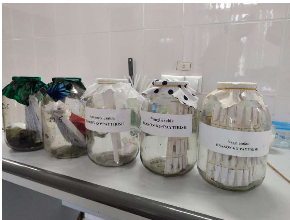
1-rasm. An'anaviy va ixtiro qilingan qurilmada ko'paytirilgan Bracon hebetor Say avlodlarini biologik ko'rsatkichlarini aniqlash va taqqoslash.

Jinslar nisbati Bracon hebetor Say ni ommaviy ko'paytirishda eng muhim biologik ko'rsatkichlardan biri hisoblanadi. Chunki urg'ochi imagolar parazitlash jarayonida asosiy faol individlar bo'lib, ular xo'jayin qurtlarga tuxum qo'yadi va keyingi avlod hosil bo'lishini ta'minlaydi. Shu sababli urg'ochi imagolar ulushining yuqori bo'lishi biolaboratoriyalarda entomofag mahsuldorligini oshirishda muhim ahamiyatga ega.