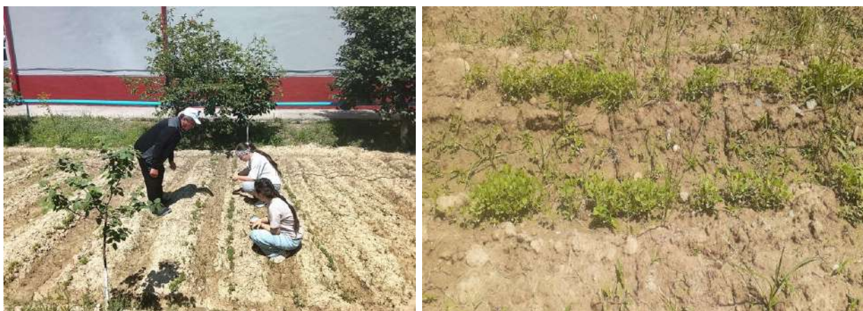
1-rasm Indigo o'simligini finalogik kuzatish jarayonlari