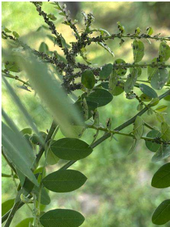
1-rasm. Yapon saforasi daraxtining akatsiya shirasi bilan zararlanishi

qilish loabatoriyasida zarakunanda va entomafaglarning tur tarkibi aniqlagich adabiyotlardan foydalangan holda laobatoriya jarayonida aniqlanib, ularning taksonamiyasi keltirildi.