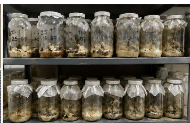
2-rasm. Galleria mellonella L. ni laboratoriya sharoitida ko'paytirish jarayoni