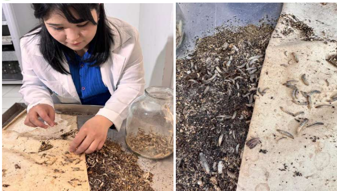
5-rasm. Katta mum parvonasi ( Galleria Mellonella )ni katta yoshdagilarni terib olish jarayoni

Qurtlarning g'umbaklanish davri 8-10 kunni tashkil qildi. Imago kapalaklar chiqishi 74-81% atrofida bo'lib, kapalaklarning fiziologik faolligi yuqori darajada saqlandi. Optimal sharoitlarda mum kuyasi avlodining to'liq rivojlanish sikli 37-45 kun davom etdi. Tadqiqotlar davomida yuqori harorat va namlikning keskin o'zgarishi qurtlarning rivojlanishiga salbiy ta'sir ko'rsatishi aniqlandi. Havo harorati 35°C dan yuqori bo'lgan sharoitda qurtlarning harakat faolligi pasayib, yashovchanlik ko'rsatkichlari kamaydi. Nisbiy havo namligining 55% dan past bo'lishi esa ozuqa muhitining qurishi va lichinkalar rivojlanishining susayishiga olib keldi. Olingan natijalar Galleria mellonella L. qurtlarini laboratoriya sharoitida uzluksiz va samarali ko'paytirish mumkinligini ko'rsatdi. Ishlab chiqilgan texnologiya Bracon hebetor Say entomofagini ommaviy yetishtirish uchun yuqori sifatli biologik ozuqa bazasini yaratishda muhim amaliy ahamiyatga ega ekani tasdiqlandi.