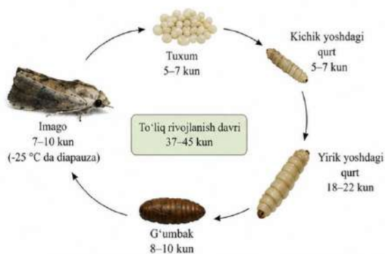
3-rasm. Galleria mellonella L. ning hayot sikli