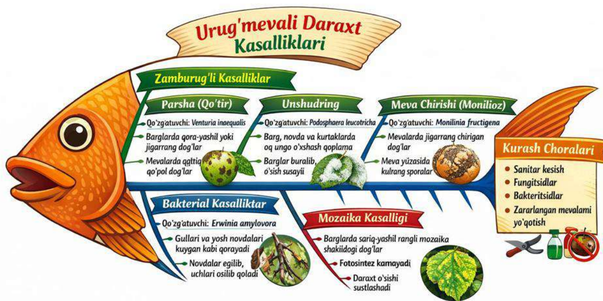
2 -rasm. Mavzu tafsilotining "baliq skeleti" usulida jamlanishi