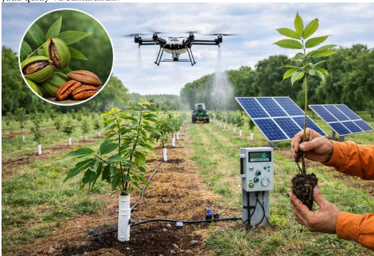
4-rasm. Mevali bog'larni kasalliklardan innovatsion himoya qilish